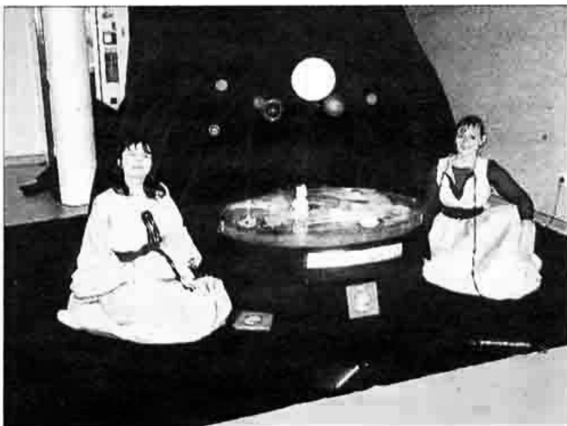
Les comédiennes du Théâtre du Signe.

V endredi 25 février, le pôle Femme-Enfant du Centre Hospitalier de Flers proposait "La petite histoire du grand début". Dans le cadre du réseau "Culture Santé" de Basse Normandie Monsieur Adam, responsable de "l'effervescence culturelle" du centre, invitait les enfants, leurs mamans et les futures mamans à la deuxième représentation de cette opération.